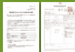
国産●高機能木部塗料「木守り専科」告示対象外製品証明書

JIS工場で生産されるJIS製品に表示することが義務づけられている、ホルムアルデヒド等級の最上位規格を示すマークです。2003年3月21日の壁紙の日本工業規格 (JIS) 改正によって、ホルムアルデヒドの放散量の性能区分を表すために新たに表示することが決められました。壁紙「JIS A 6921」規格における改正のポイントは4項目あり「ホルムアルデヒドに関する基準取り決め」が主な内容となっています。F★★★★と表示されている建材や内装材だけが、建築基準法によって使用量が制限されません。F★★★★やF★★になると条件付きの使用や使用量の制限があり、F★のものは内装材としての使用は禁止されています。