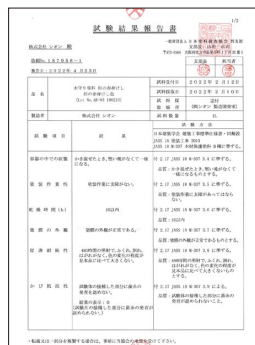
▲JASS18 M307 木材保護塗料 (WPステイン)試験結果報告書

※4:経年度合いが進行していると、木の導管がかなり広がっている影響で、「2回塗装+ふきとりなし」では赤みをカバーしきれない場合があります。その際は、白太材のように仕上がるまで、「ふきとりなし」での塗装を3~4回以上行ってください。